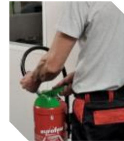
Extincteur à poudre polyvalente de 2KG